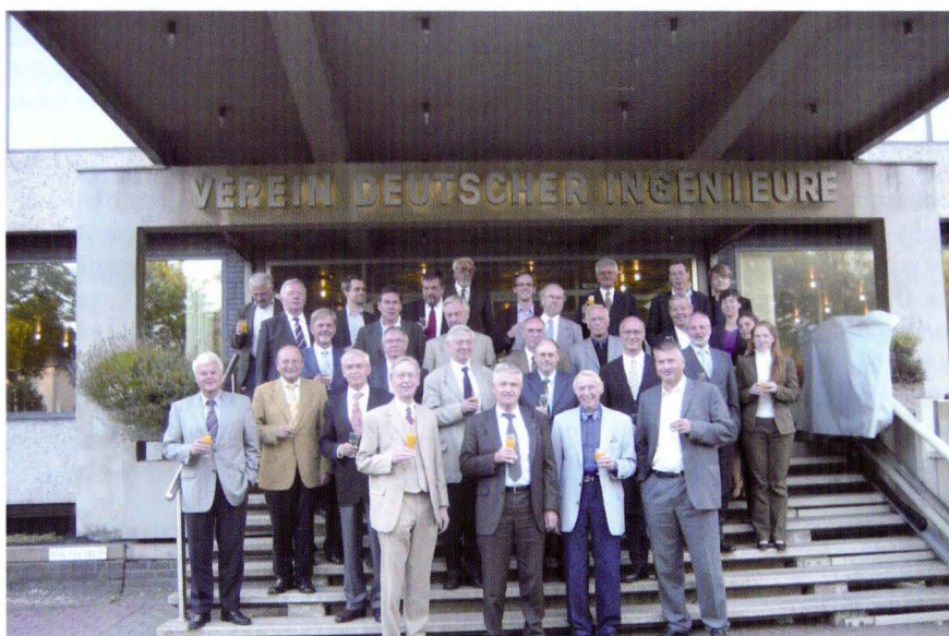
... und des 1000. Studiengangs im September 2007