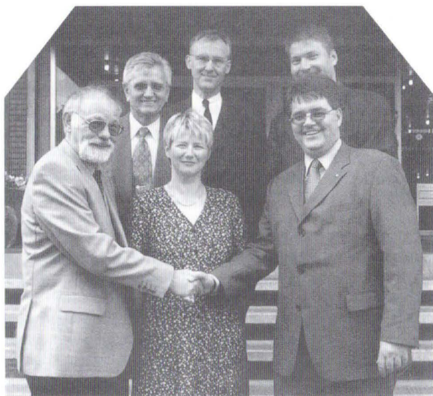
Akkreditierung des ersten Studiengangs im Juli 2001